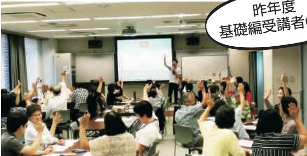
昨年度 基礎編受講者の声

地域貢献・コミュニティ活動・市民活動・協働の推進に興味のある方は、市内外を問わずどなたでも参加可能です！お気軽にご参加ください。